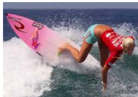
Trois mois avant l'attaque du requin

gement dans des actions d'aide comme «World Vision» et de faire don ainsi à d'autres d'une grande partie de ses revenus, spécialement à des enfants et des adolescents. Elle rend visite également à des soldats qui ont été blessés grièvement. Au sujet du film documentaire « Heart of a soul surfer» (Le cœur d'une surfeuse spirituelle) de 2007, elle dit : je voudrais transmettre un message ! Et cela lui réussit lors de ses conférences partout dans le monde. Le message de cette jeune femme de 19 ans, c'est la nouvelle de l'amour de Dieu pour nous les humains et de l'aide apportée par notre foi en Jésus-Christ dans les temps difficiles. ■