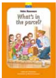
Cette histoire est aussi parue dans un livre pour enfant en anglais

J'avais essayé tout au long de la nuit tout ce qu'il était humainement possible de faire pour aider la jeune mère, à la maternité, mais malgré nos efforts elle mourut. Elle nous laissait un minuscule prématuré et une fillette de deux ans en pleurs. Il allait être difficile de garder le bébé en vie, car nous n'avions pas de couveuse, ni aucune possibilité de nourrir l'enfant correctement. Nous vivions sous l'équateur, et pourtant les nuits étaient souvent froides avec des vents surnois. Une élève sage-femme alla chercher la boîte et le coton que nous utilisions pour de tels bébés. Une autre alla attiser le feu et remplir la bouillotte. Elle revint bientôt, complètement désespérée, et me raconta que notre dernière bouillotte avait éclaté au remplissage. Sous le climat tropical, le caoutchouc devient rapidement poreux. Dans notre monde occidental il est vain de pleurer pour le lait renversé: il est aussi vain, en Afrique centrale de s'affliger à cause des bouillottes éclatées. Elles ne poussent pas sur les arbres et dans la forêt vierge il n'y a pas de droguerie. Je dis : «o.k. ! pose le bébé aussi près que possible du feu, et ensuite tu dormiras entre lui et la porte pour qu'il n'ait aucun courant d'air. C'est ton devoir de garder le bébé au chaud ».